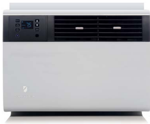
Modelos Kühl SQ/EQ

ENCAJA EN VENTANAS DE 22" A 42" DE ANCHO