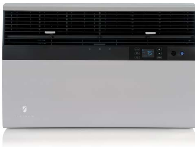
Modelos Kühl SS, SM y SL Modelos Kühl+ ES, YS, EM, YM, EL y YL

ENCAJA EN VENTANAS DE 27 3/8" A 42" DE ANCHO