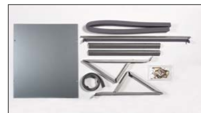
KWIKSB, KWIKMB, KWIKLB